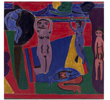
Tal R, Malmö Konstmuseum

195 kr inkl ett glas vin/alkoholfritt och smörgås. | Max 50 deltagare.