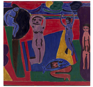
Tal R, Malmö Konstmuseum

950 kr inkl entréer, guidningar, förmiddagsfika och lunch. | Max 49 deltagare.