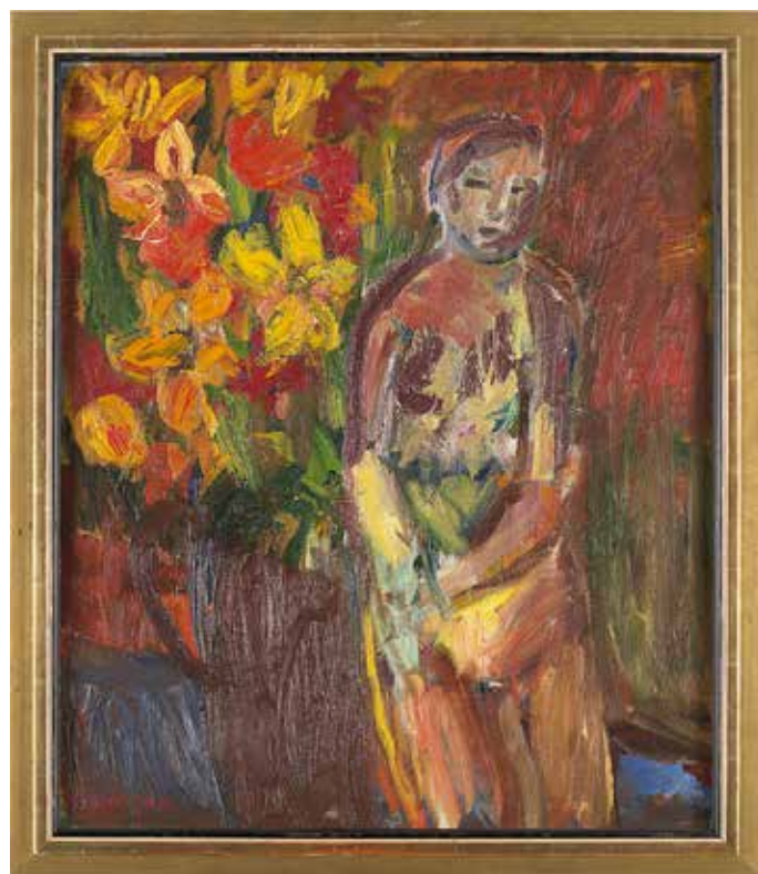
Kvinna och blomsterbukett, Ivan Ivarsson.

Och det som började mycket lokalt fick med tiden ett brett genomslag och blev en konstrikning med nationell räckvidd vars livskraft inte minskats av mytbildningen runt flera av konstnärerna och deras av psykiska ohälsa.