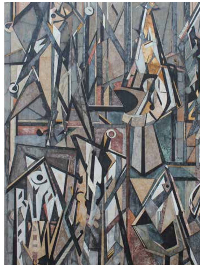
Marmorintarsia vid Axel Dahlströms torg, Endre Nemes.

En av föreningens grundidéer var att stödja konstnärer genom inköp, verk som sedan lottades ut till föreningens medlemmar, men också att visa konst för en bredare allmänhet. De första årtiondena handlade det företrädesvis om Düsseldorfmaleriets nationalromantiska landskapsmåleri, i Sverige representerat av bland andra Marcus Larson och Bengt Nordenberg.