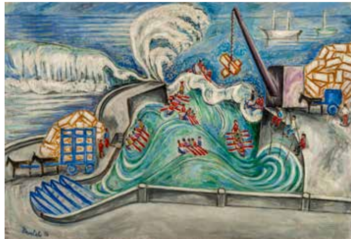
Hamn vid Atlantiska Oceanen, Nils Dardel.