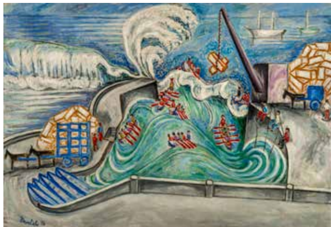
Hamn vid Atlantiska Oceanen, Nils Dardel.