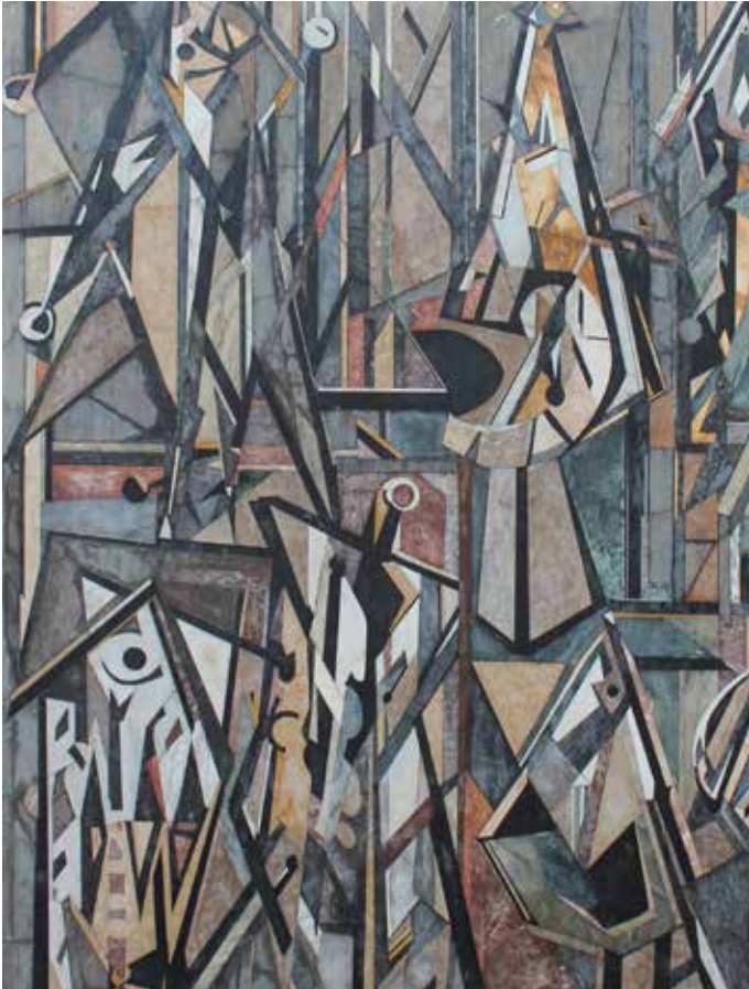
Marmorintarsia vid Axel Dahlströms torg, Endre Nemes.