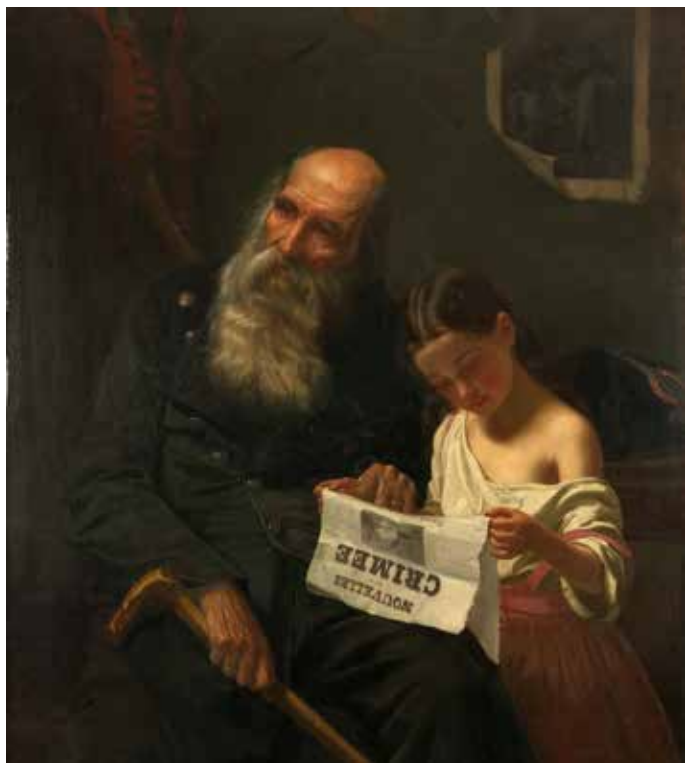
Nyheter från Krimkriget, Geskel Saloman.