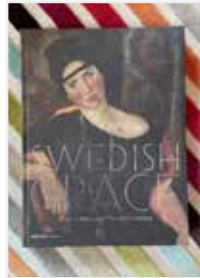
Utställningskatalog Swedish Grace