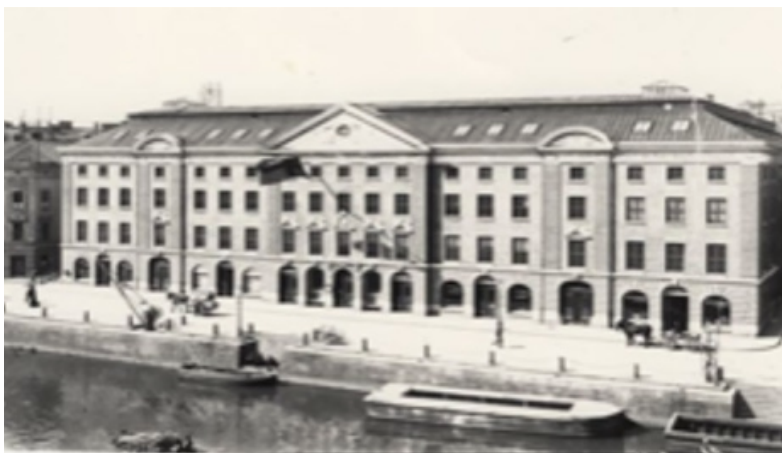
Göteborgs Stadsmuseum, se aktivitet sidan 5