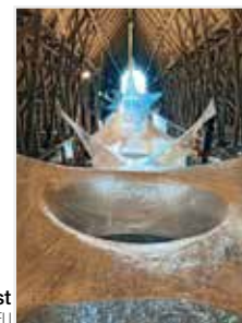
Wanås Konst