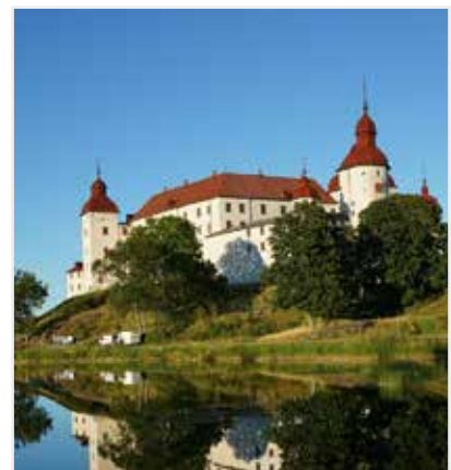
Läckö Slott

Max 50 deltagare. Obs! Begränsad tillgänglighet på Läckö Slott. Det finns ingen hiss i slottet.